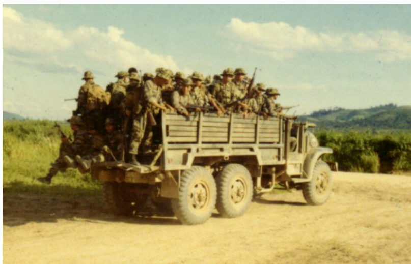
Xe GMC

Tôi thấy trong mắt anh Đạt, Khải, Hằng... có những giọt nước mắt không rơi ra được, nó ngập ngừng đọng lại ở khóe; xót xa và đau đớn. Riêng tôi, tôi đang có một tâm trạng khác, tôi cảm thấy gần gũi với bé Lan hơn, tôi không ứa nước mắt cho chị Bích vì chị đang có cả một gia đình bên chị, có bố mẹ, các em, các con chị, Tôi đang ứa nước mắt cho mình và cho cả bé Lan. Quanh chúng tôi đoàn người vẫn rất đông, chia thành từng nhóm nhỏ, như một cuộc cắm trại lớn, nghỉ ngơi lung tung, tự nhiên tôi bật cười, ai cũng ngạc nhiên nhìn tôi dò hỏi; tôi nói cảm nghĩ của mình: "Hôm qua cả thành phố rủ nhau đi du lịch, hôm nay cả thành phố cùng nhau đi cắm trại," câu ví von của tôi làm mọi người cười xòa, chị Bích khen: "giáo sư văn chương có khác, Thủy nhận xét hay thật," Hằng nói tôi có máu khô hài,... ít nhất thì tiếng cười cũng làm cho mọi người bớt căng thẳng.