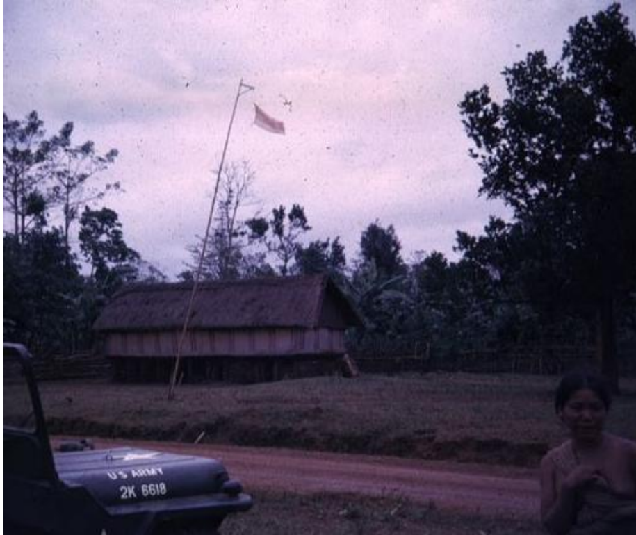
Nhà rông (sưu tầm từ internet)

hơn vì nơi đây đẹp quá, tâm hồn chúng tôi dễ dàng rung động trước vẻ đẹp của thiên nhiên dù bất cứ lúc nào và bất cứ ở đâu... Nhưng thôi; phải lên đường.