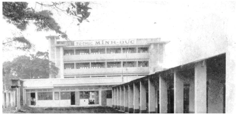
Trường Minh Đức

Mỗi lần tôi đến nhà chị Bích chơi, Hằng thường mở cassette nghe nhạc, pha cà phê uống, nhìn những giọt cà phê nhỏ xuống ly đầu óc tôi mông lung, trống rỗng.... Lúc này tôi rất muốn vào Phi trường Cù Hanh tìm Bang để nhờ vả 1 chỗ ngồi trên 1 chiếc máy bay nào đó..., nhưng tự ái của tôi đã ngăn tôi lại, mấy lần xe lam dừng trước cổng phi trường, tôi chỉ đứng bên ngoài nhìn khung cảnh người ta nhốn nháo, chen lấn, la hét, cãi cọ nhau; như một khán giả nhìn các diễn viên trên sân khấu; thế thôi, rồi tôi buồn bã quay trở về phòng trọ lặng lẽ khóc: "anh ơi, anh rất gần mà lại cũng rất xa;" Phi trường Cù Hanh không còn đi hieu vắng vẻ nữa, với chiến sự này ai cũng muốn dành lấy cho mình một phương tiện nhanh nhất, an toàn nhất để rời khỏi Pleiku. Thời gian này tâm hồn tôi luôn giao động, âu lo và tuyệt vọng. Mỗi lần thầy trò gặp nhau, đều nhìn nhau quyến luyến như thể sẽ không bao giờ còn được thấy nhau. Những ngày này tôi khóc nhiều lắm, may mà có gia đình chị Bích, có Hằng, Khải... bên cạnh.