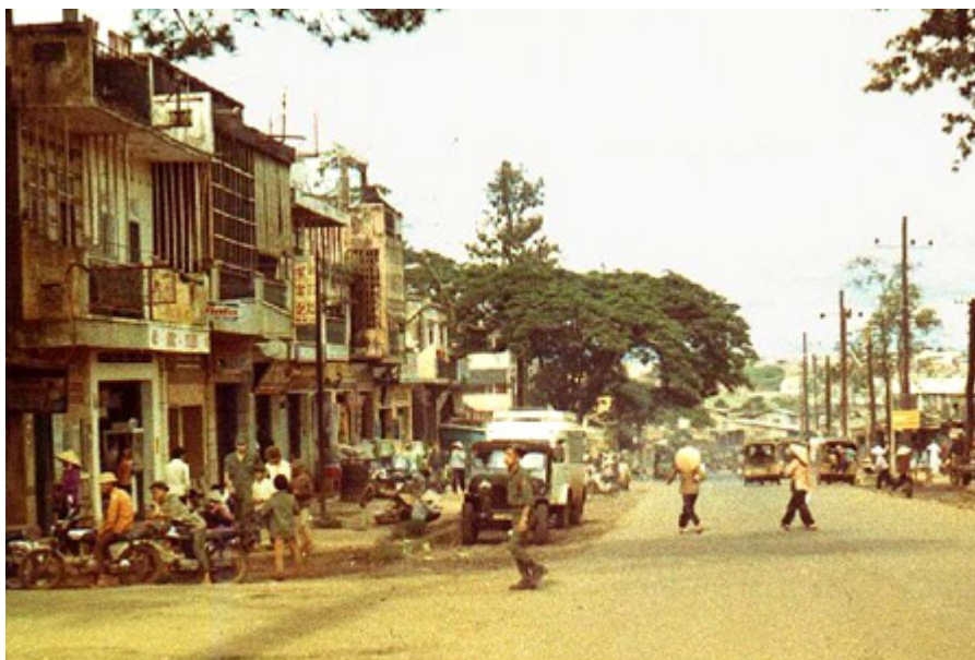
"Miền đất đỏ bụi mù" Pleiku