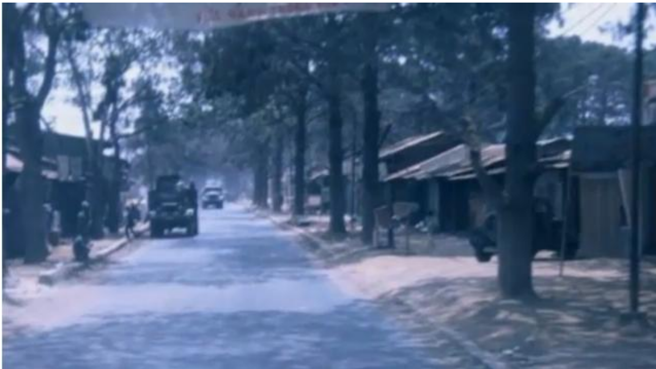
Phố núi Pleiku

Tôi đến Pleiku vào một chiều cuối tháng 9 - 1973 với tờ Sự Vụ Lệnh trong tay. Nhiệm sở là trường Nam Trung Học Pleiku. Máy bay đáp xuống Phi trường Cù Hanh lúc 4 giờ chiều, trời lất phất mưa, đường bay loang loáng nước, dọc theo sân bay là hàng rào kẽm gai chạy dài tít tắp, ngoài hàng rào kẽm gai là những luống bắp xanh mượt mà, đất đỏ quánh bên dưới, mây xám giăng lưng trời. Tôi lên xe Ca về thành phố. Tâm hồn vừa hoang mang lo lắng, vừa bồn chồn nao nức vì khung cảnh xa lạ, điều hiu và cuộc sống mới đang chờ đợi tôi; cô sinh viên vừa mới rời khỏi ghế giảng đường trường Đại Học Đà Lạt. Xe chạy qua những vùng đất trống đầy cỏ non, nương rẫy toàn là một màu xanh của cây và lá. Gần vào thành phố mới thấy được vài dãy nhà, có lẽ là trại gia binh, hiu hắt, chơi vơi buồn trong mưa.