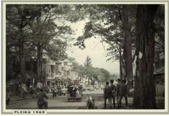
Trường Trung Học Pleiku