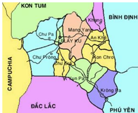
Bản đồ vùng núi Gia Lai