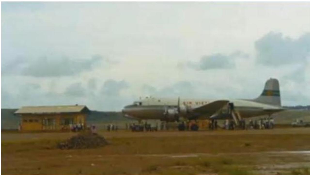
Nhà chờ Phi Trường Cù Hanh

Đêm nay nằm giữa núi rừng xa lạ này, bên dưới là giòng sông Adun nhuộm máu, bên trên là người chết nằm ngổn ngang, dù nhắm mắt cố hết sức để dễ giấc ngủ, nhưng những cảnh tượng và những âm thanh của ngày hôm nay cứ luẩn quẩn trong đầu tôi, tai tôi vẫn còn nghe những tiếng thét hãi hùng, mắt tôi vẫn còn thấy người mẹ trẻ ôm chặt trong tay tấm khăn lông như ôm một đứa bé, phải chăng lúc bỏ chạy chị đã làm tuột mất con mình mà không hay? còn nữa; người đàn ông tay dắt đứa con trai nhỏ, tay ôm bọc đồ; vừa chạy vừa gào tên vợ và con gái; tôi cũng đã thấy một bà già chạy không nổi, cứ té lên té xuống; khóc gào: con ơi chờ má với. trời ơi có người kéo lết một chân, còn chân kia nát bấy cố tìm sự sống, sau đó gục xuống, ngất đi vì mất nhiều máu và vì đau đớn, chắc bây giờ ông ta đã chết, không ai cứu ai trong lúc đó, ai cũng phải tự cứu mình cái đã. Tôi rùng mình; giấc ngủ không đến được khi hình ảnh nọ nổi tiếp hình ảnh kia, như một khúc phim quay lại, chậm rãi, từ từ; hiện ra rõ rệt từng chi tiết; từng đoạn; kia: một cô gái rất trẻ với bàn tay nát bấy vừa chạy vừa ôm cánh tay bê bết máu, lao đảo, liêu xiêu, kia nữa; ông già đang bám vào vai tôi để vượt qua sông, ngang giữa dòng thì... chiu... ông ngã xuống, tuột khỏi vai tôi, máu tuôn ra xối xả vì một viên đạn bay trúng ngay đầu, âm vang của tiếng súng cứ xoáy trong tôi rền rĩ buốt tai, tôi không muốn nhớ, tôi không muốn thấy lại những gì đã xảy ra, nhưng sao nó cứ đùa cợt với tôi mãi như thế này?