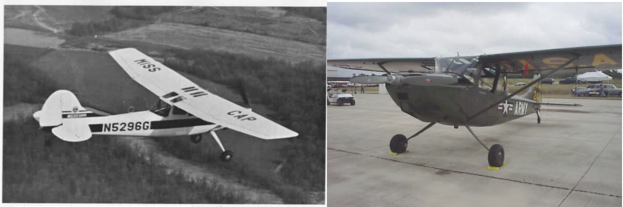
Máy Bay L19

chân như vai trong khi mọi người lăn xả, bé Ly lim dim mắt ngủ tôi không dám rời tay khỏi bụng bé, sợ nó giật mình thức dậy, chị Bích hát ru những câu ca dao rời rạc... chiều nay mưa sao mà buồn quá.