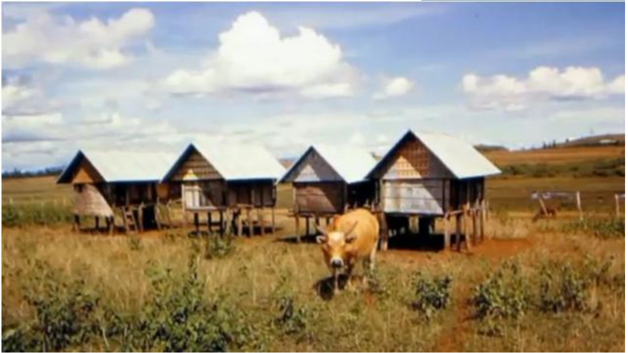
Buôn thượng nghèo

Mặc dù đây chỉ là 1 buôn Thượng nghèo nhưng có còn hơn không, đám con trai lại đi tảo thanh lương thực, Tôi và Hằng dù mệt vẫn muốn đi theo nhưng bị la: chỉ vướng chân. Tôi nhìn quanh chỗ mình ngồi: nơi đây là một rừng tre dại; thân tre nhỏ bằng cườm tay của tôi, không cao vút như tre làng Phú Cam của tôi, nó cũng mọc từng bụi, chúng tôi xuống sông rửa mặt, nước sông mát rượi làm dịu cơn mệt. Bao nhiêu lần vượt sông là bấy nhiêu lần hy vọng, nhưng bên này sông hay bên kia sông cũng thế mà thôi, vẫn chỉ là sự hoang vắng, là rừng cây; bãi cát cùng với sự thình lặng của không gian. Tôi cảm thấy chung quanh mình mịt mù vây phủ không lối thoát. Chiều nay; ngồi trên đồi với một rừng tre xanh mượt, tôi nhìn xuống dòng sông bên dưới, tôi nghĩ về mình, tôi tìm tôi trong kỷ niệm, kỷ niệm của tôi lảng đãng mờ hơi sương, tại sao tôi cứ mãi nhớ nhung về những tháng ngày đã qua? đi như thế này lắm lúc tôi muốn nổi loạn, muốn gào thét thật to, rồi tôi lại muốn khóc; khóc thật lớn, khóc cho bể cả không gian mà trút tất cả mọi thứ đang chất chứa trong tâm hồn tôi để không còn lại một thứ gì, cho tâm hồn tôi được nhẹ nhàng thanh thản.