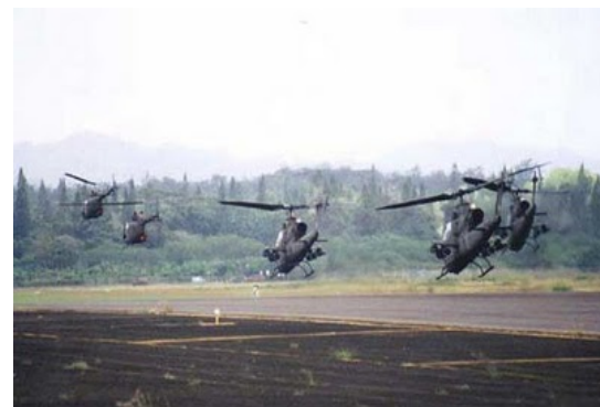
Phi vụ Biệt kích