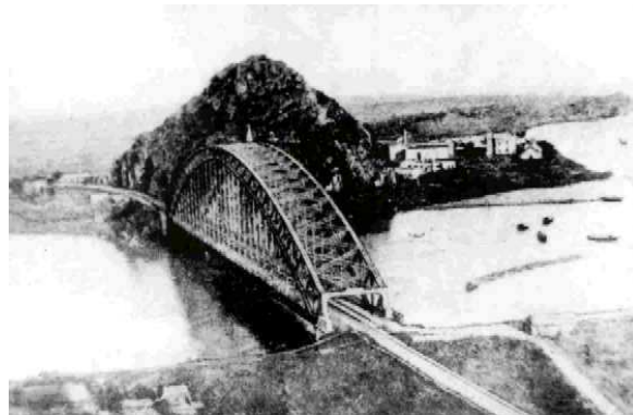
Hàm Rồng