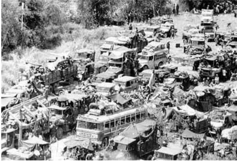
Đoàn xe di tản

Đoàn xe tiếp tục chạy, trời tối nhanh, tất cả các xe phải bật đèn lên, ánh đèn pha của đoàn xe nối đuôi nhau sáng lóa, lấp lánh dài vô tận trong đêm đen hun hút; tôi ví von gọi đó là: con rắn đom đóm khổng lồ.