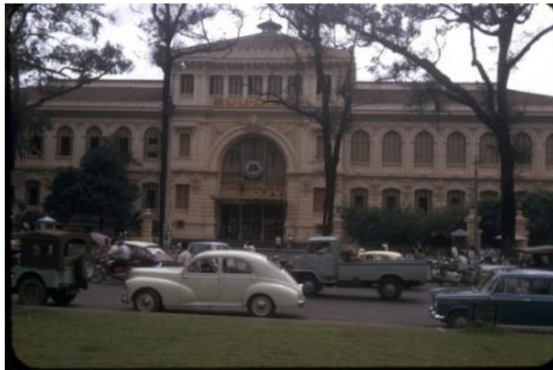
Sài Gòn