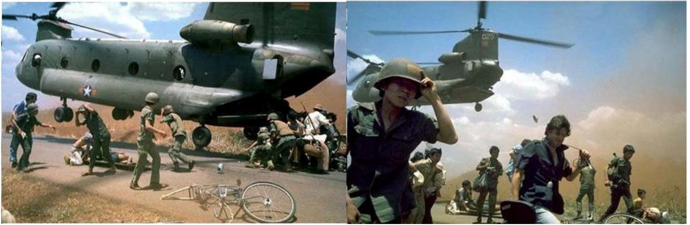
Quân đội VNCH