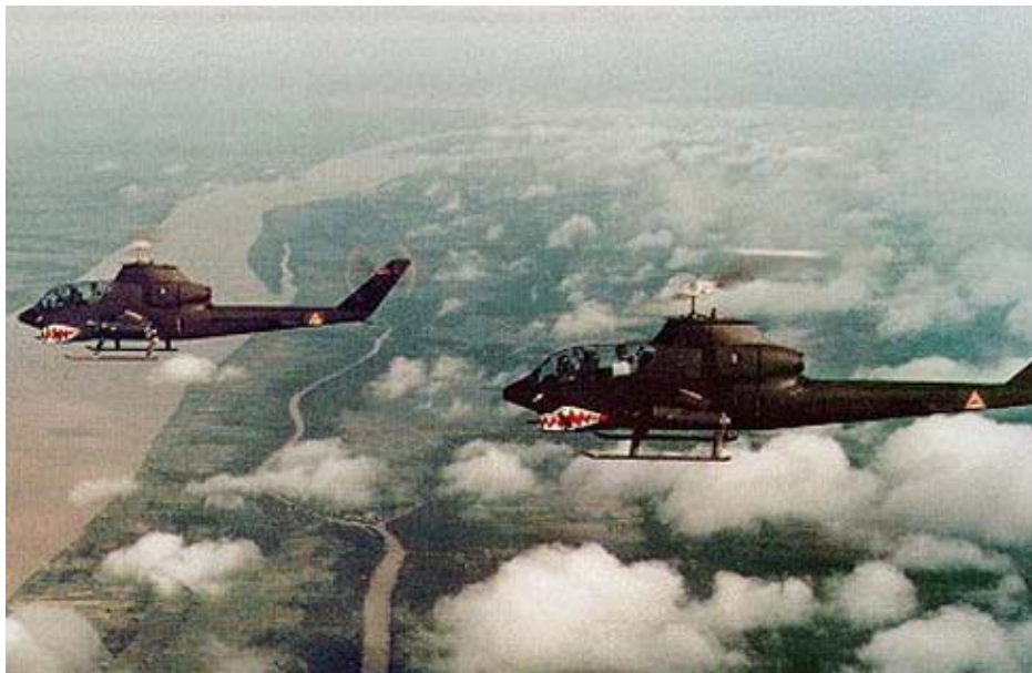
Trực thăng sư đoàn 6 không quân vũ trang (sưu tầm từ internet)