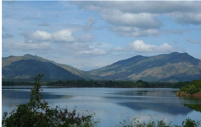
Biển Hồ Pleiku

Thành phố nhỏ bé, với vẻ đẹp hoang sơ; nhà lẫn trong cây còn phố ẩn trong mây, có rất nhiều lính đi lại trên đường. Đây là thành phố của Quân Đội, những anh chàng phi công bay bướm với calor đội lệch trên đầu; lãng mạn trong bộ Conbinaison, các chàng Biệt Động Quân, Lôi Hồ, Biệt Kích, ngang tàng oai phong trong bộ đồ rằn ri... Vừa xuống xe ca tôi giật thót mình khi nghe những tiếng đại bác "ầm ì" từ xa vọng lại, nhưng chung quanh tôi mọi người vẫn có vẻ bình thản đứng đưng như đã quá quen thuộc với âm thanh này.