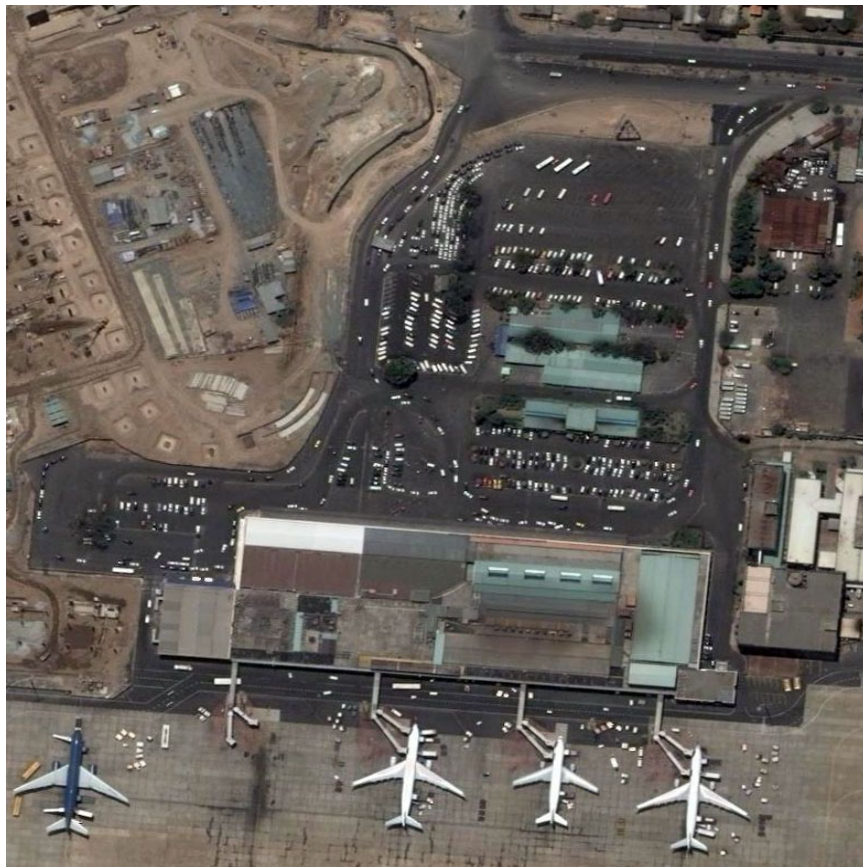
Phi trường Cù Hanh