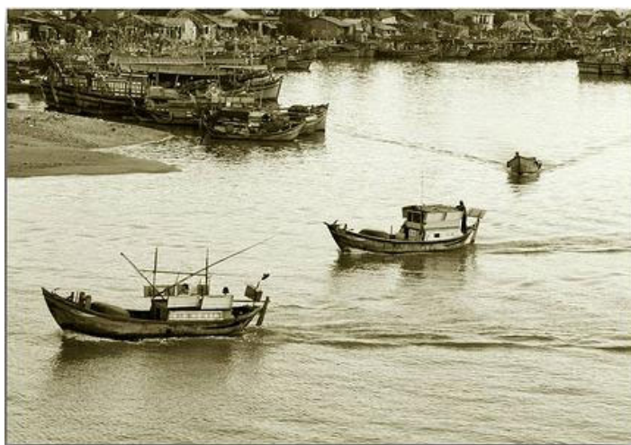
Cảng cá cầu Xóm Bóng

- Bây giờ con ra cảng cá cầu Xóm Bóng, kiếm một chiếc ghe đánh cá rồi mượn chủ ghe chạy vô Sài Gòn, cha biết có một số người trong giáo xứ rất muốn trốn vào SG nhưng chưa biết phải đi bằng cách nào, cha viết cho con mấy lời giới thiệu, con cứ theo địa chỉ cha ghi trong thư này mà đến gặp người ta, họ cũng ở gần đây thôi, cha chúc con đi đường được bình an, vào SG gặp cha mẹ rồi nhớ cho cha gửi lời thăm. Bây giờ cha ban phép lành cho con, xin Thiên Chúa và Đức Mẹ Maria gìn giữ con trong những ngày sắp tới... nhớ phải rất cẩn thận vì có mấy người trong ban quân quản và du kích canh chừng gắt gao ghê lắm... cha nghe nói có một số người chỉ mới ra bến cá, đứng gần mấy chiếc tàu cá thôi mà đã bị bắt rồi đó.