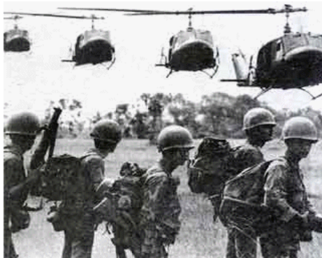
Biệt động quân

Những ngày sau đó tôi bận rộn với bao nhiêu là công việc, trước tiên trình diện với ông Hiệu Trưởng, mượn nhà ở, nhận lớp, nhận thời khóa biểu, mua sách và tài liệu để dạy học.. Tôi tạm quên đi nỗi nhớ nhà, nhớ cha mẹ, nhớ vú, và lại nơi thành phố này còn có người yêu của tôi đang ở, nên tôi không cảm thấy buồn. Nhờ vợ thầy hiệu trưởng giới thiệu nên tôi mượn được một cái phòng trên gác nhỏ của ngôi nhà số 7 Đường Tăng Bạt Hổ, đối diện hông nhà thờ Quân Đội. Anh chị chủ nhà tên Ninh, trước cổng nhà có cây hoa ngọc lan tỏa hương thơm ngào ngạt. Mặc dù phi trường Cù Hanh cách thành phố Pleiku 05km nhưng nếu lắng tai vẫn nghe được tiếng các loại máy bay, khu trục bay lên đáp xuống, trực thăng và L19 suốt ngày lượn ngang lượn dọc trên bầu trời đầy mây; nó đã trở thành một hình ảnh quen thuộc đối với người dân trong thị xã; mà phần đông họ là những người thân của lính. Xa xa tiếng súng đại bác từ căn cứ Hàm Rồng vọng về ì ầm hòa nhịp với tiếng phi cơ bay lượn vù vù trên không làm cho Pleiku; vốn rất hiền lành mộc mạc, nên thơ và lãng mạn lại mang sắc thái của chiến tranh; vừa có vẻ đe dọa vừa trấn an vỗ về. Những ngày mới đến lòng tôi đầy sợ hãi nhưng rồi cũng quen dần, lâu ngày lại cảm thấy điều đó thật bình thường, có những đêm hỏa châu chiếu sáng một góc trời, phía phi trường Cù Hanh có nhiều tiếng nổ rung chuyển mặt đất, máy bay bay vụt lên hồi hả trong đêm đen, đó là lúc phi trường bị pháo kích dữ dội, tôi thường bị thức giấc nhưng mãi rồi cũng quen.