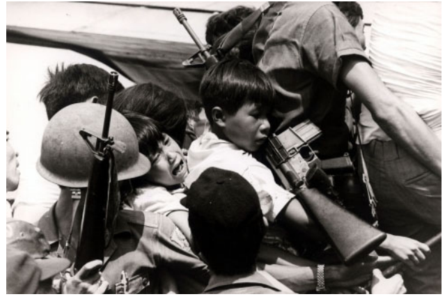
Quang cảnh hỗn loạn