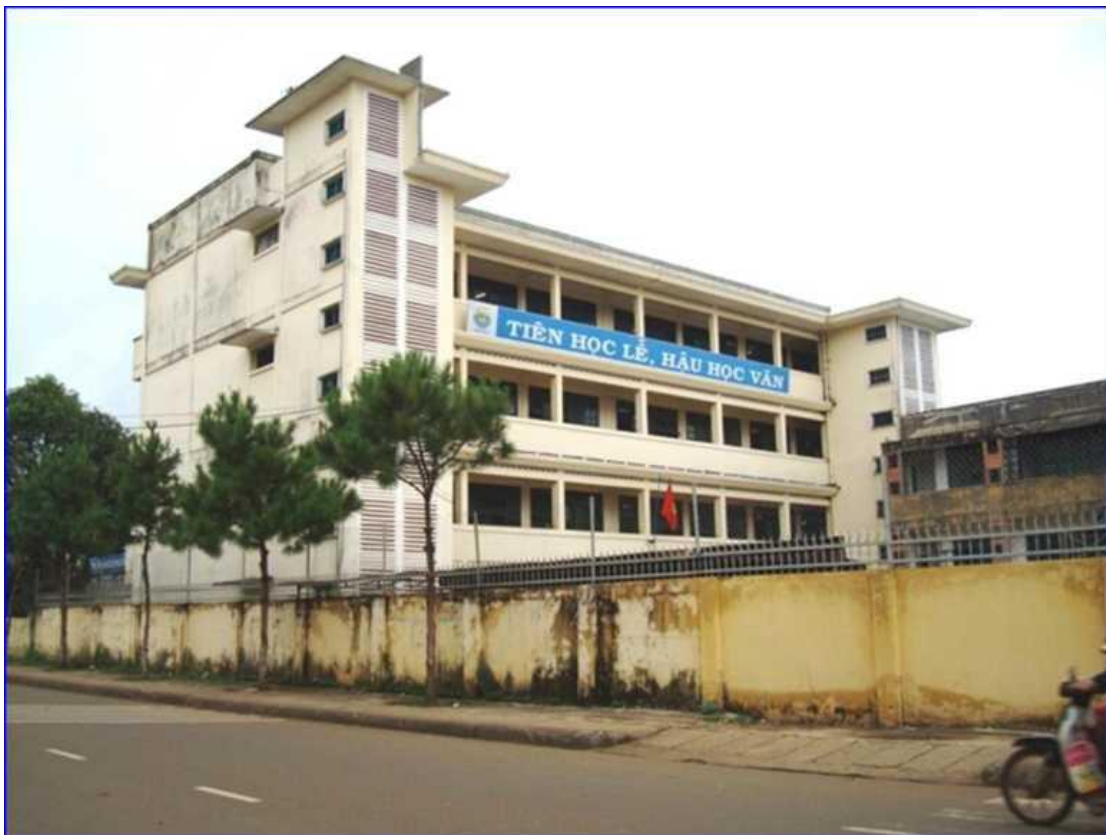
H4: Trường phổ thông cấp 3 Pleiku