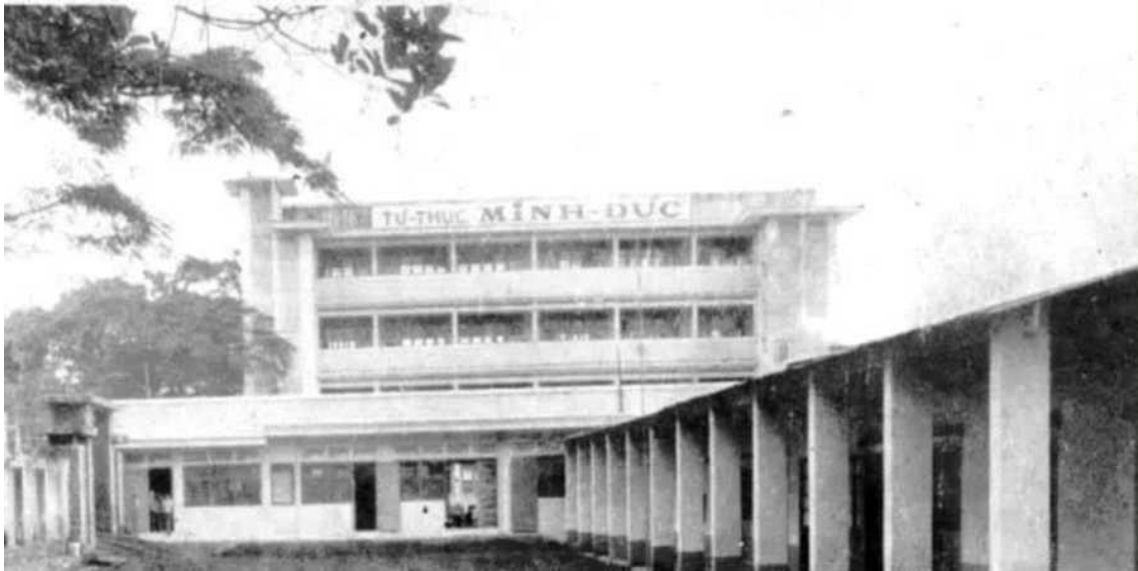
H3: Trường Trung tiểu học Tư Thục Minh Đức