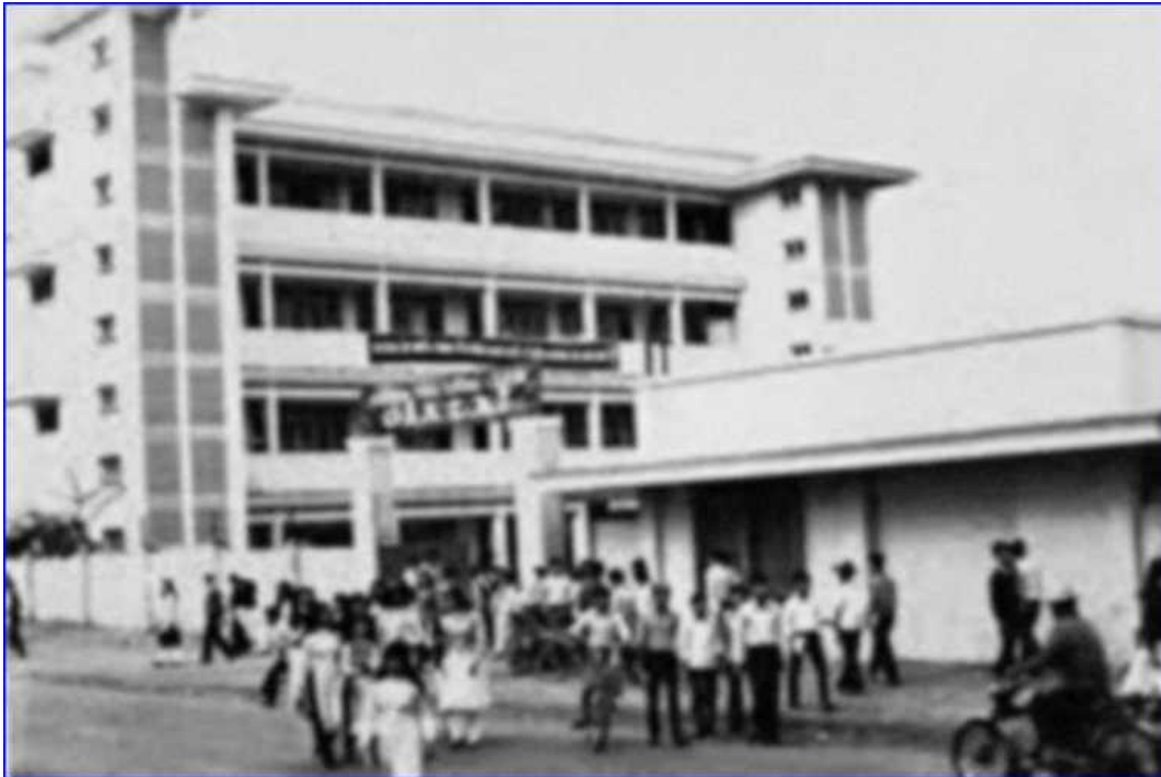
H5: Trường cấp 3 Pleiku