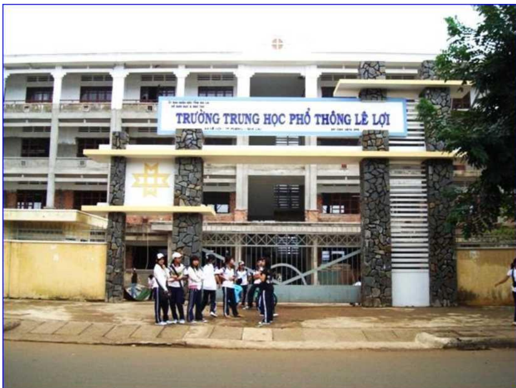
H6: Trường phổ thông Lê Lợi hiện nay.