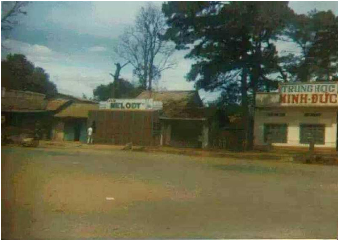
H1: Một góc VĂN PHÒNG TRƯỜNG TRUNG HỌC TƯ THỰC MINH ĐỨC