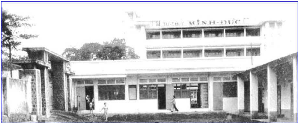
H2: Văn phòng Trường TTH Minh Đức (lúc này đang cải tạo sân chơi bên Tiểu học)